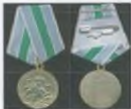
Медаль «За оборону Севастополя»